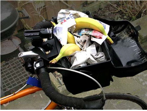
Bananen in der Packtasche

Nun, wir kennen da einen eifrigen Rennradfahrer, der auch gern mal bei unseren Touren mitfährt: Der hat seine spezielle Lösung für das beschriebene Transportproblem: