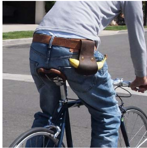
Die Luxus-Variante aus Leder