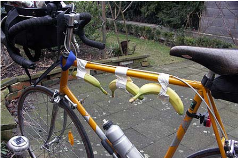
"Rahmenhalter" für Bananen

Aber muss es gleich eine ganze Packtasche sein? Ein dem Autor dieses Beitrags gut bekannter Kollege hält eine so einfache wie innovative Lösung des Transportproblems bereit: die Banane am Fahrradrahmen. Zugegeben, Vorbereitungen und Abbau dauern etwas, ein Messer wäre auch angebracht. Aber das Ergebnis kann sich schmecken lassen.